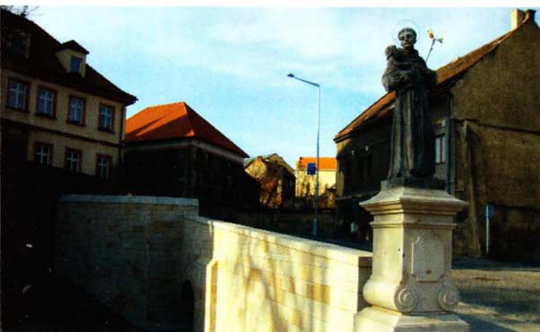
▼ Rekonstrukce železničního mostu v Kolině (Cena za dopravní infrastrukturu)